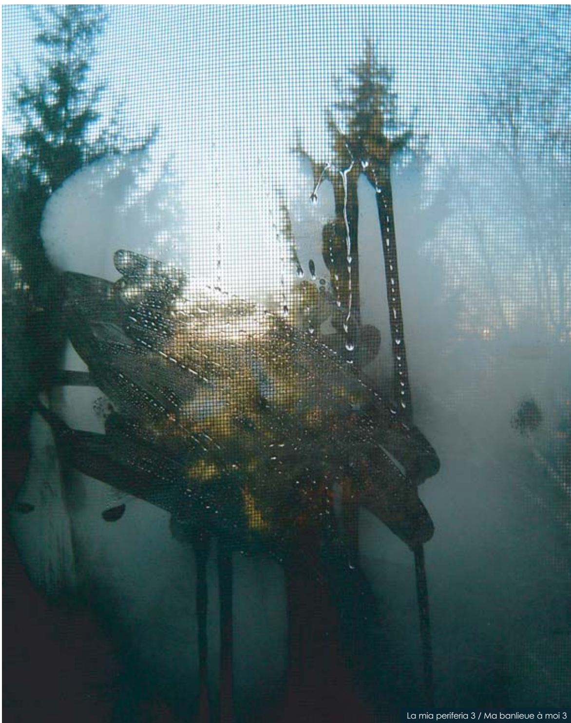
La mia periferia 3 / Ma banlieue à moi 3

Istituto d'Istruzione Superiore "Modigliani" – Giussano (MB)