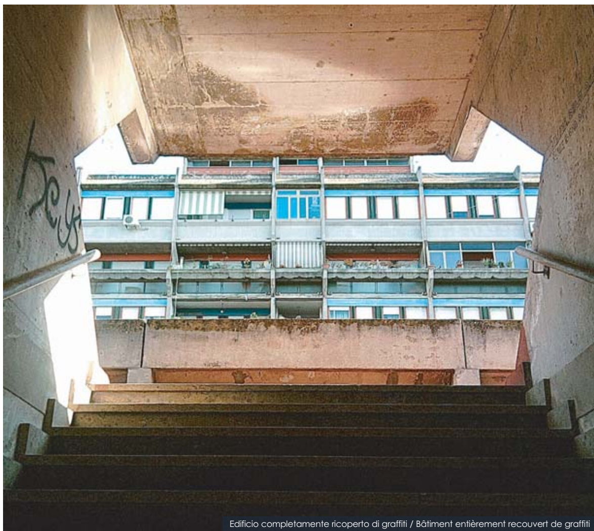
Edificio completamente ricoperto di graffiti / Bâtiment entièrement recouvert de graffiti

Istituto professionale di Stato "Virginia Woolf" - Roma