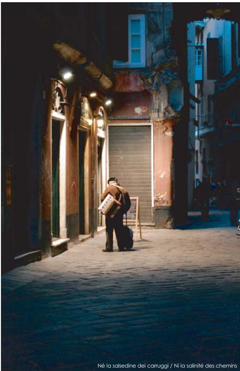
Né la salsedine dei carruggi / Ni la salinité des chemins