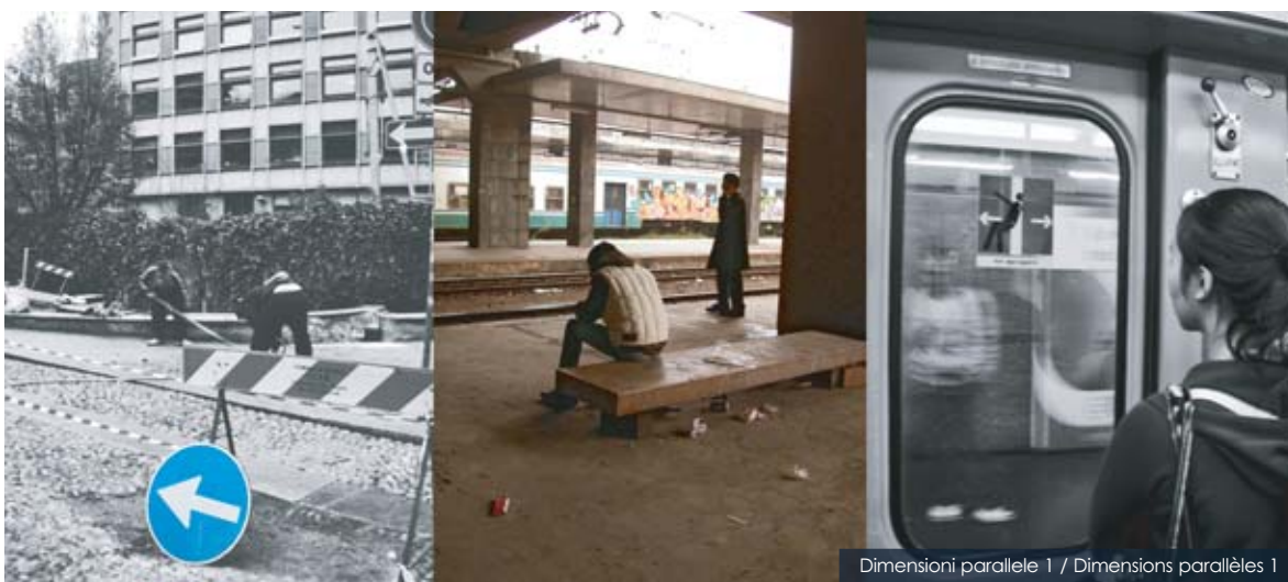
Dimensioni parallele 1 / Dimensions parallèles 1

Istituto d'Istruzione Superiore "Modigliani" – Giussano (MB)