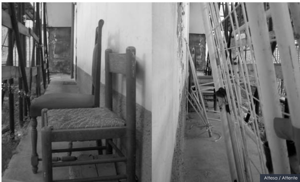
Attesa / Attente

Istituto d'Istruzione Superiore "Modigliani" – Giussano (MB)