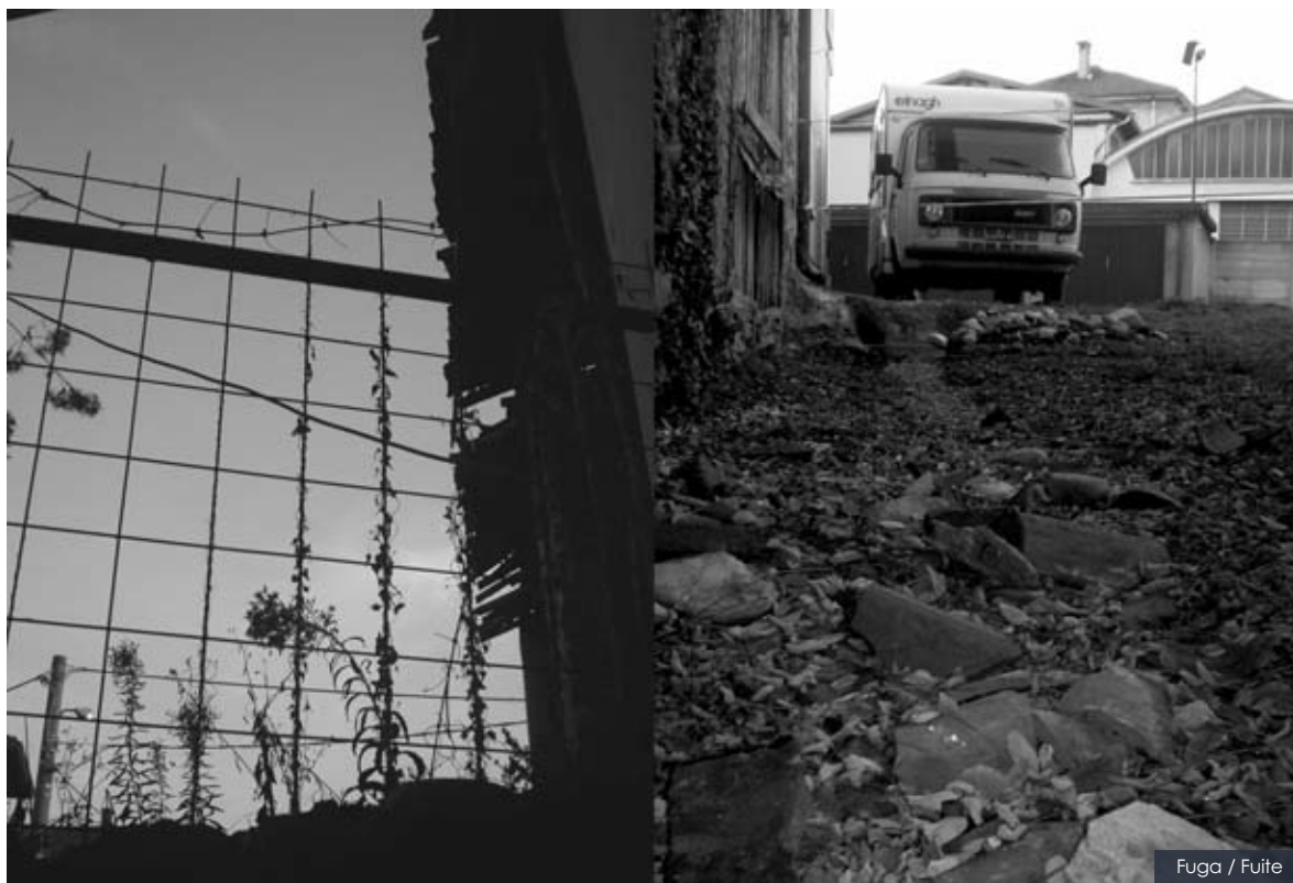
Fuga / Fuite

N on una casa ma un luogo in cui sentirsi al sicuro, dove la tua identità è segnata da un pezzo di scotch. Il luogo dove ti fermi ad aspettare qualcosa... anche solo un piccolo cambiamento che però non arriva. Il luogo da cui vorresti scappare, scappare con qualsiasi mezzo.