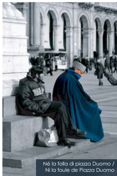
Né la folla di piazza Duomo / Ni la foule de Piazza Duomo

N on c'è più un posto per chi ha lasciato tutto. Non c'è più patria, non come prima. Non c'è casa, non strada, non c'è l'amico di una vita da salutare all'angolo. Non sembra esserci una parte da recitare, non più la certezza di essere nel proprio mondo, di appartenere ai ricordi e agli oggetti come essi appartengono a te. Gli odori, ogni veduta, gli sguardi, ogni passo, nulla è propriamente tuo, di nulla più ti senti padre. E porti, tu padre, il tuo futuro, la tua famiglia in un posto altrove, qualunque e nessuno. Loro nasceranno figli di quel posto. Non per te ci sarà la semplice felicità di essere a casa. E lungo vicoli bui, immerso in piazze affollate, di fronte ad ogni sole sorto su pietre non tue, là ti sentirai straniero, ti sentirai solo, come se il tuo colore e i colori di tutto il resto, no, non potessero far parte, forse neanche un secondo, della stessa fotografia.