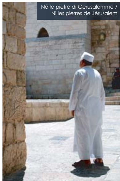
Né le pietre di Gerusalemme / Ni les pierres de Jérusalem