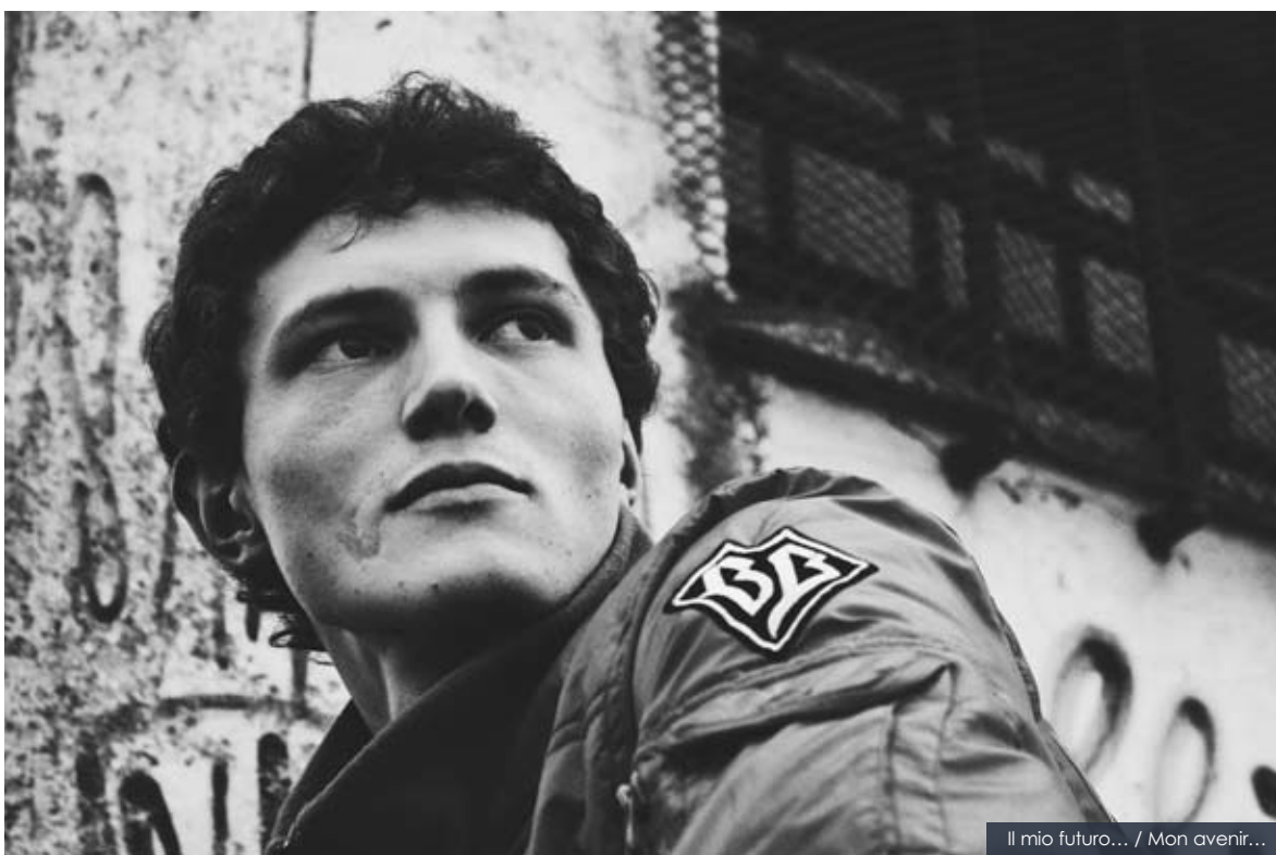
Il mio futuro... / Mon avenir...

L a periferia come luogo di identificazione, come spazio che mostra un vissuto: storie di giovani, del loro mondo, dei loro disagi e dei loro sogni.