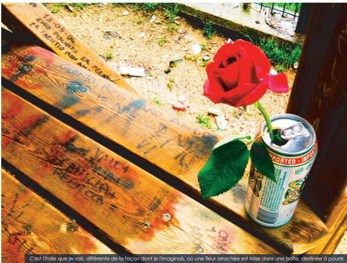
C'est l'Italie que je vois, différente de la façon dont je l'imaginai, où une fleur arrachée est mise dans une boîte, destinée à pourrir.

Istituto professionale di Stato "Virginia Woolf" - Roma