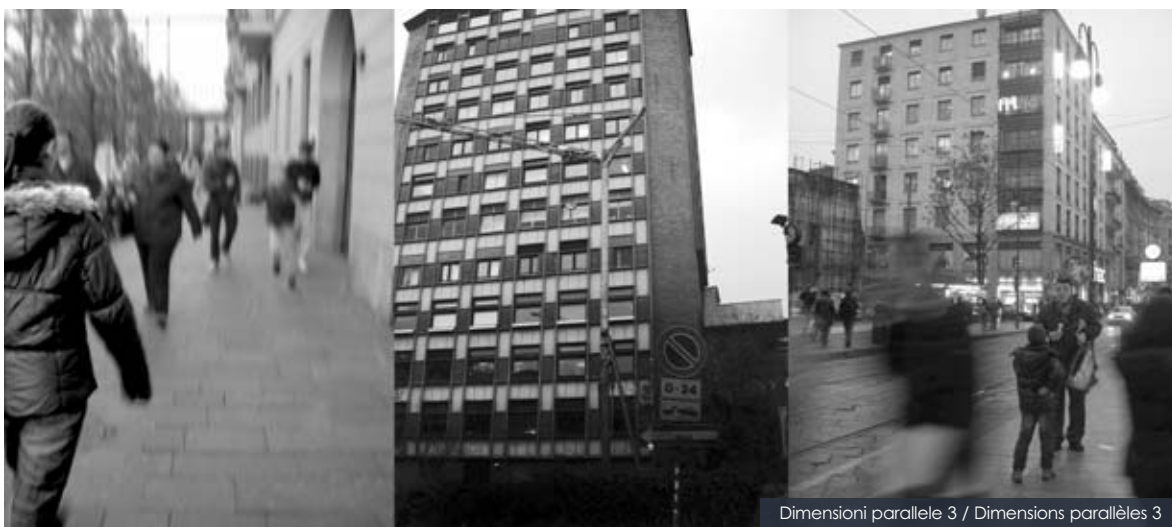
Dimensioni parallele 3 / Dimensions parallèles 3

« T utto è ordinato, regolato dall'alto, ogni cosa che ti accade, ti accade perché ha un senso» (S. Tamaro, Va dove ti porta il cuore )