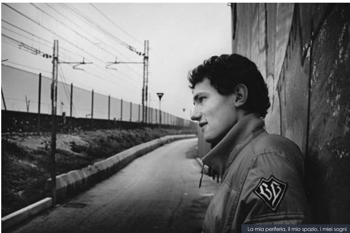
La mia periferia, il mio spazio, i miei sogni

Istituto Tecnico per Geometri "Genga" - Pesaro